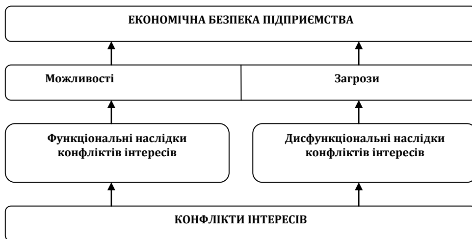
Рис. 3. Вплив конфліктів інтересів на економічну безпеку підприємства

Вплив конфліктів інтересів зображено на рисунку