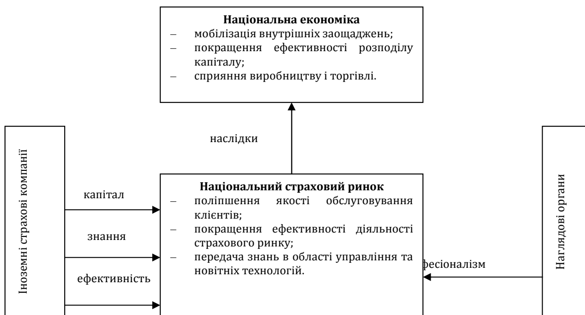
Рис. 2. Вигоди від лібералізації страхового ринку [7; 8]

страхового ринку є вихід іноземних страховиків на національні страхові ринки, тобто відбувається лібералізація внутрішніх ринків: узгодження правил регулювання страхових відносин, ліквідація бар'єрів для вільного «перетікання» фінансових ресурсів (рис. 2).