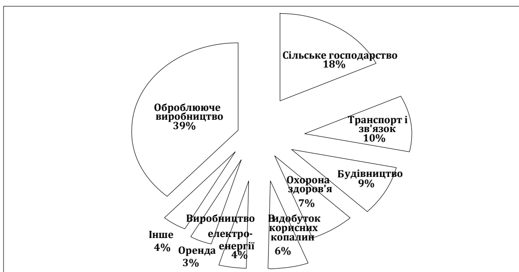
Рис. 2. Питома вага робітників з тимчасовою непрацездатністю за видами економічної діяльності М. Горлівка у 2011 році

діяльності спостерігаються такі втрати робочого часу (рис. 2): 18,1% – сільське господарство, полювання, лісівництво; 10,3% – транспорт і зв'язок; 9,2% – будівництво; 6,5% – охорона здоров'я; 6,1% – видобуток корисних копалин; 4,3% – виробництво і розподіл електроенергії, газу і води; 3,2% – операції з нерухомістю, оренда; 3,5% – інше; 38,7% – обробляюче виробництво.