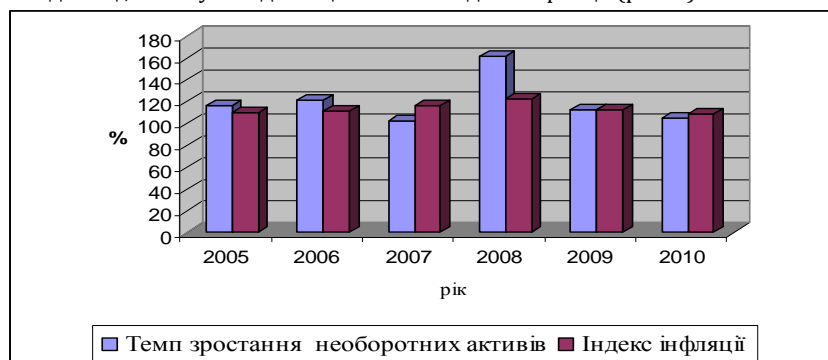
Рис. 1. Темп зростання необоротних активів та індекс інфляції за період 2005-2010 рр.,%

Порівняємо темп зростання необоротних активів і індекс інфляції (рис. 1)