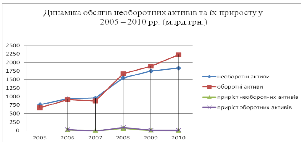
Рис. 2. Динаміка обсягів необоротних та оборотних активів та їх приросту у 2005 – 2010 рр. (млрд. грн.)

що обумовлено фінансовою кризою того періоду, однак у 2010р. збільшується.