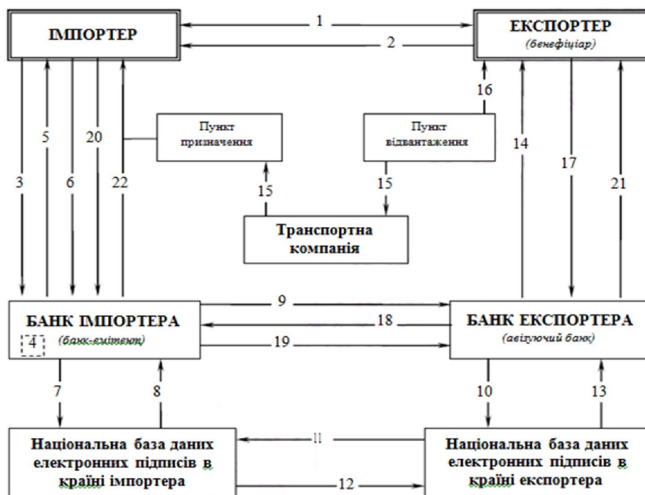
Рис. 2. Принципова схема здійснення розрахунків з використанням електронного акредитиву

Запропонована схема (рис. 2) суттєво доповнює традиційний механізм здійснення акредитивної форми розрахунків, одночасно зберігає її позитивні риси і дає нові переваги в її застосуванні.