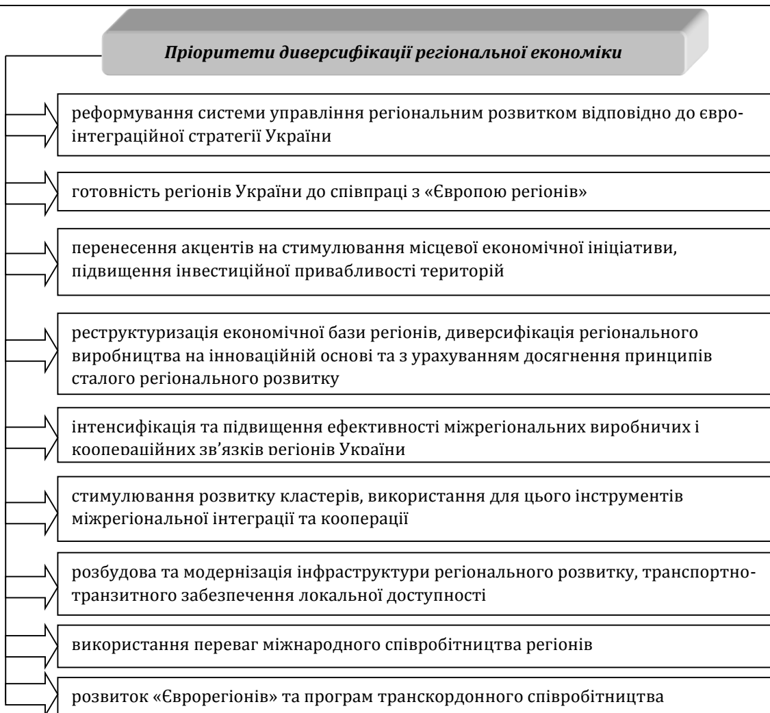
Рис. 2. Ключові пріоритети диверсифікації регіональної економіки

Згідно з чинним законодавством регіональний розвиток трактується як винятково позитивні зміни у соціальних, економічних, екологічних, гуманітарних, етнонаціональних процесах на рівні регіонів відповідно до загальних цілей державної стратегії розвитку. Тому соціально-економічний розвиток нерідко ототожнюється з поняттям економічного розвитку - процесом структурної перебудови економіки відповідно до технологічного та соціального прогресу, що виражено показниками ВВП, ВВП, НД на душу населення. Це поняття відображає не лише кількісне економічне зростання, але й якісне поліпшення добробуту населення. Найбільш поширеними можна назвати такі ознаки регіонального розвитку: напрям розвитку, сфера прояву, масштаб поширення, рівень стабільності змін, ступінь їх динамічності, рівень управління, джерело походження, характер внутрішніх факторів, відношення економічного зростання та екологічної безпеки, гармонійність, стабільність, збалансованість, рівновага, конкурентоспроможність, безпека сталого розвитку, глибина інтеграції до світового господарства та інші.