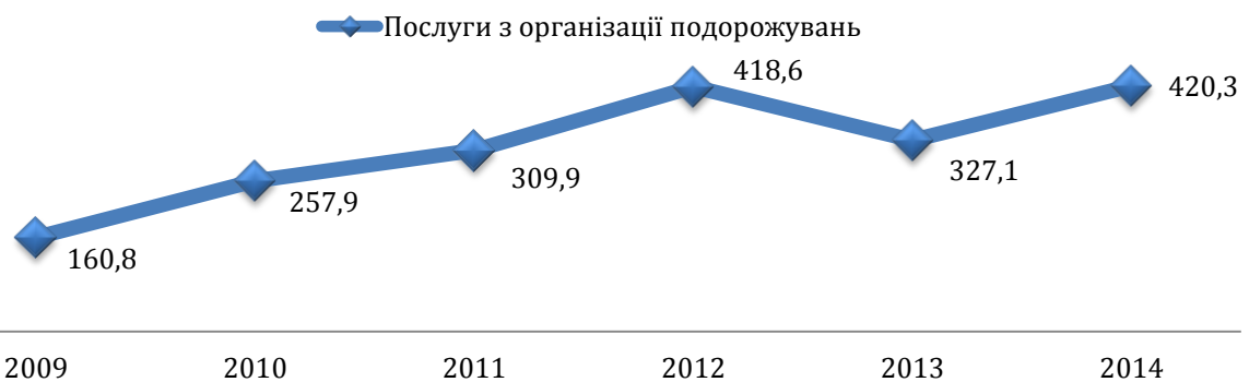
Рис. 2. Динаміка обсягу реалізованих послуг з організації подорожей (млн грн)

* Складено автором на основі джерела [6]