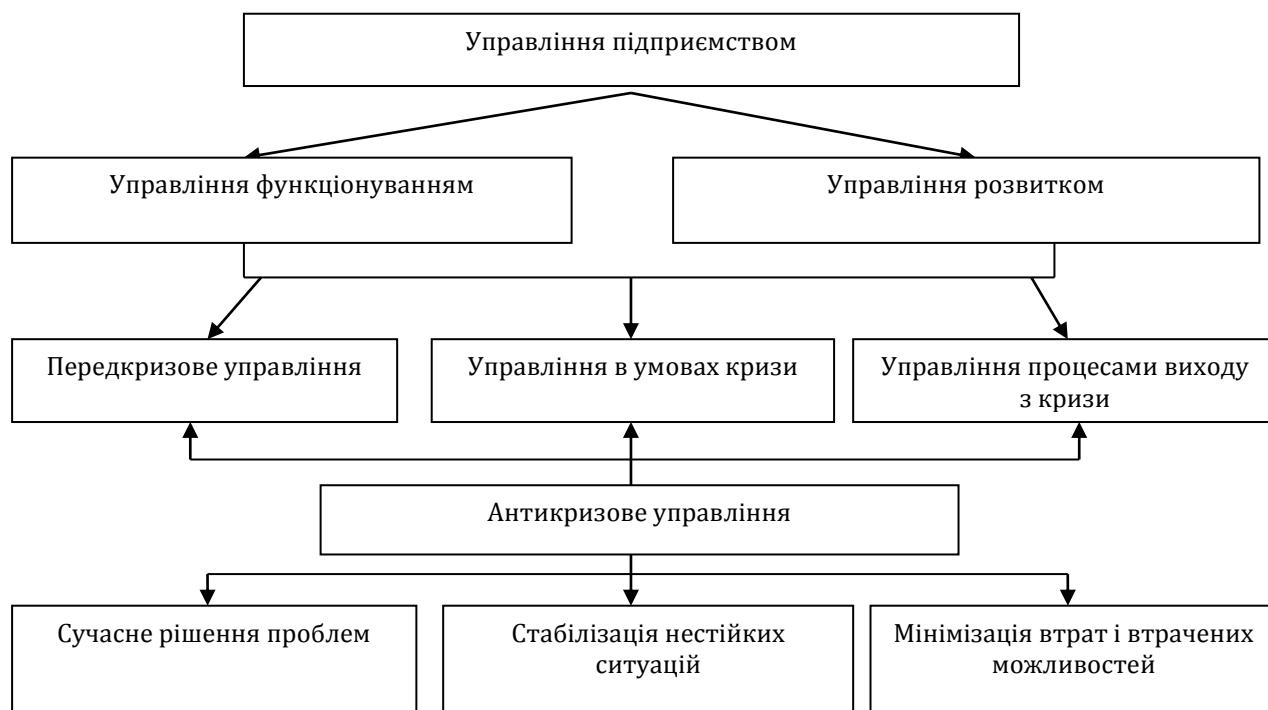
Рис. 1. Складові антикризового управління