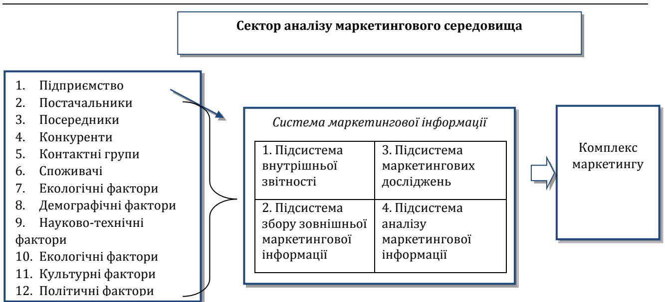
Рис. 1. Сектор аналізу маркетингового середовища на підприємстві

Демографічні фактори для підприємств-виробників будівельних матеріалів, зазвичай, не важливі, оскільки їх споживачі — будівельні організації.