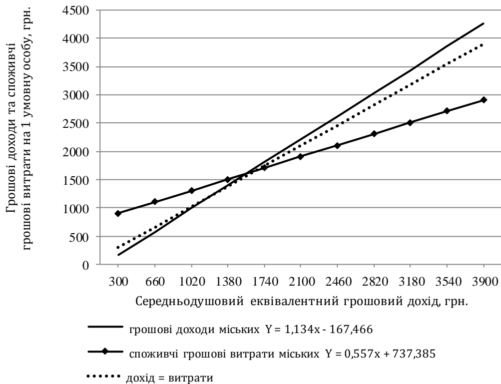
Рис. 1 Функції грошового доходу та грошових споживчих витрат міських домогосподарств

Оскільки для характеристики диференціації населення за рівнем матеріального добробуту критерієм групування обрано інтервали середньодушових еквівалентних грошових доходів, то необхідною передумовою моделі став розрахунок грошових доходів та грошових споживчих витрат на одну умовну особу. Друга передумова моделі полягала у виборі як незалежної змінної медіанного значення інтервалу еквівалентних грошових доходів для кожної групи розподілу. Ці дані надалі були використані для виведення лінійних функцій грошових доходів та грошових споживчих витрат на основі методу апроксимації. Графічний вигляд цих моделей зображено на рисунках 1-2.