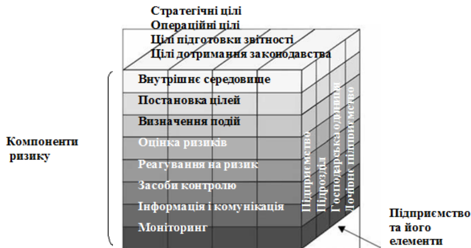
Рис. 2. Інтегрована модель COSOERM*

ураховуватися керівництвом у процесі формування стратегії і постановки цілей. Ризики оцінюються (англ. Riskassessment) з урахуванням ймовірності їх виникнення та впливу з метою визначення того, які дії стосовно них необхідно вжити. Ризики оцінюються з погляду притаманного й залишкового ризику. Керівництво вибирає метод реагування на ризик (англ. Risk response) – ухилення від ризику, прийняття, зменшення або перерозподіл ризику, розробляючи заходи, які дадуть можливість звести виявлений ризик відповідно до його припустимого рівня і ризик-апетиту підприємства. Засоби контролю (англ. Control activities), політика і процедури мають бути розроблені і встановлені таким чином, щоб забезпечувати «розумну» гарантію того, що реагування на ризики, які виникають, відбувається ефективно і своєчасно.