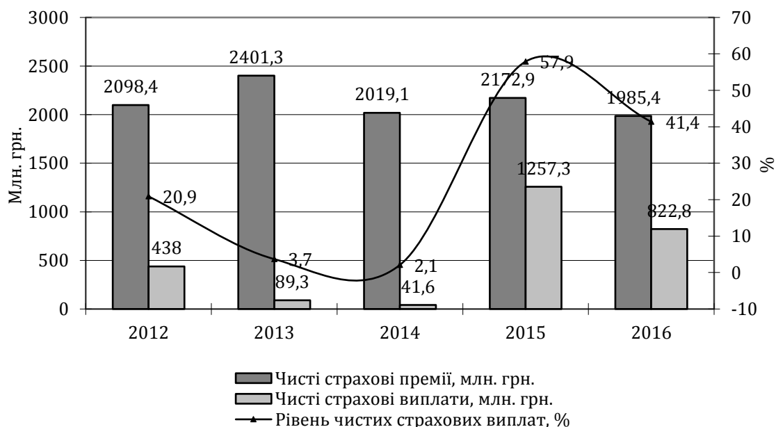
Рис. 2. Динаміка обсягу чистих страхових премій та страхових виплат, рівня чистих страхових виплат зі страхування фінансових ризиків у 2012-2016 рр.

Динаміку обсягу чистих страхових премій та страхових виплат, а також рівня чистих страхових виплат зі страхування фінансових ризиків упродовж 2012-2016 рр. можна бачити на рис. 2.