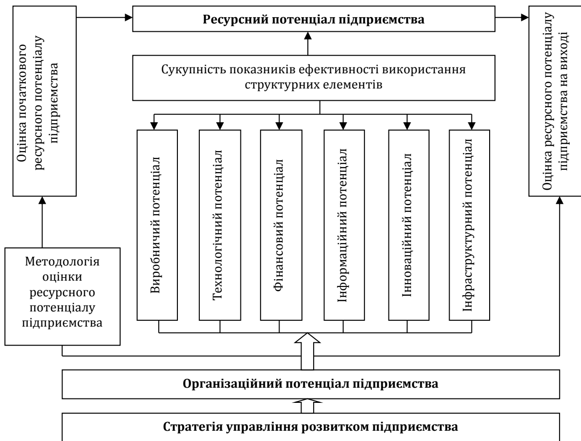
Рис. 2. Організаційний потенціал у системі управління розвитком ресурсного потенціалу підприємств АПК

Напрямок розвитку ресурсного потенціалу підприємства АПК задається його базовою стратегією діяльності, яка враховує способи формування конкурентних переваг у стратегічних зонах господарювання. Для реалізації цих способів доцільно використовувати не лише власні ресурсні можливості, а й можливості інших учасників агроринку – за умови, що їх спільне використання забезпечуватиме ефект ресурсної і ринкової синергії і буде вигідним для усіх партнерів. Для цього використовуються організаційно-управлінські компетенції потенційних учасників інтеграції, які й формують їх організаційний потенціал – потенціал ефективної організаційної взаємодії.