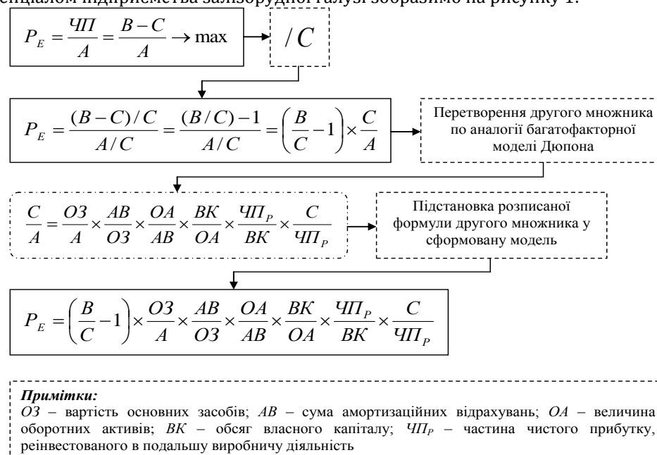
Рис. 1. Багатофакторна модель стратегічного управління фінансово-економічним потенціалом підприємств залізорудної галузі

Таким чином, процес трансформації модифікованої моделі стратегічного управління фінансово-економічним потенціалом підприємства залізорудної галузі зобразимо на рисунку 1.