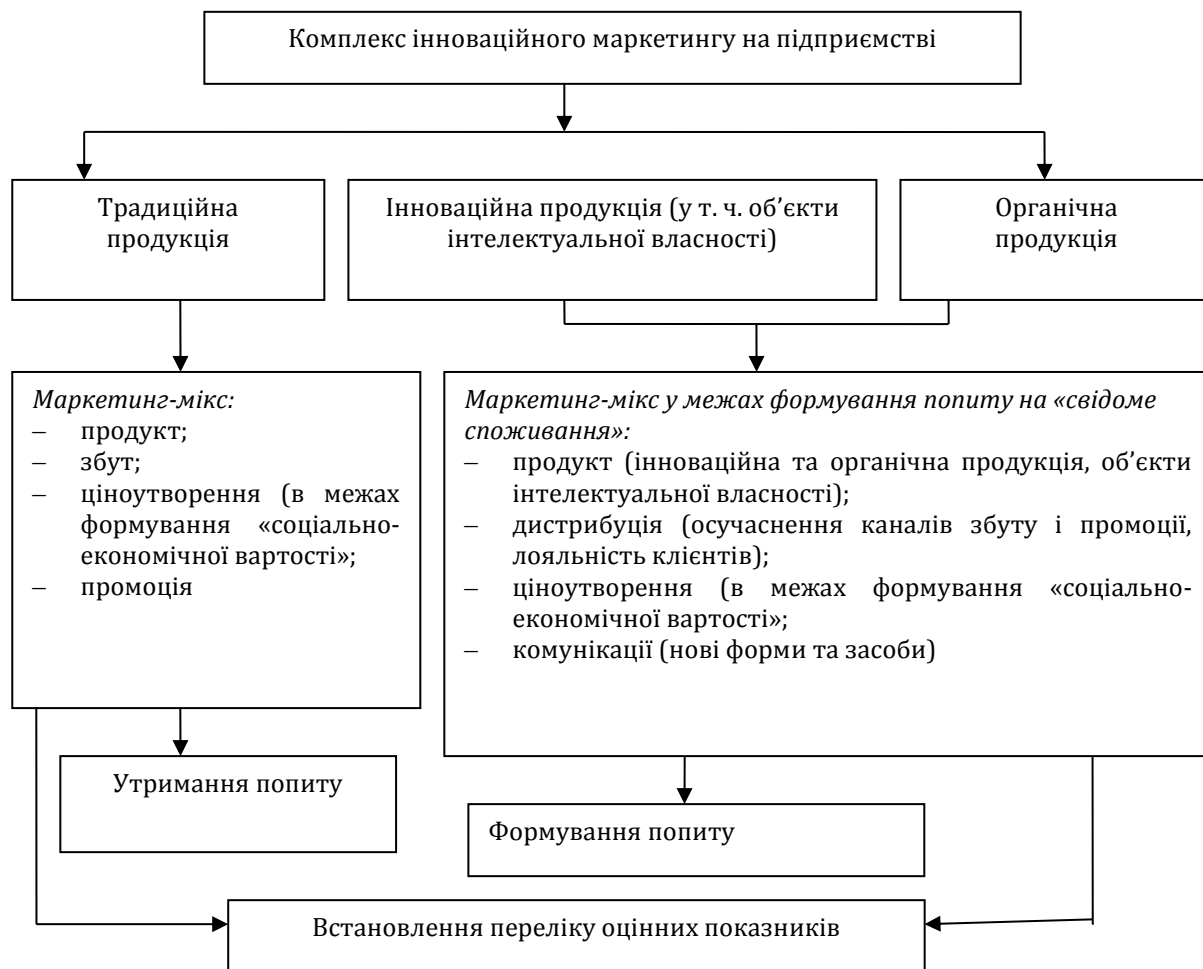
Рис. 2. Структура комплексу інноваційного маркетингу на підприємстві

структуризації комплексу інноваційного маркетингу на підприємстві необхідним є визначення оцінних критеріїв і показників.