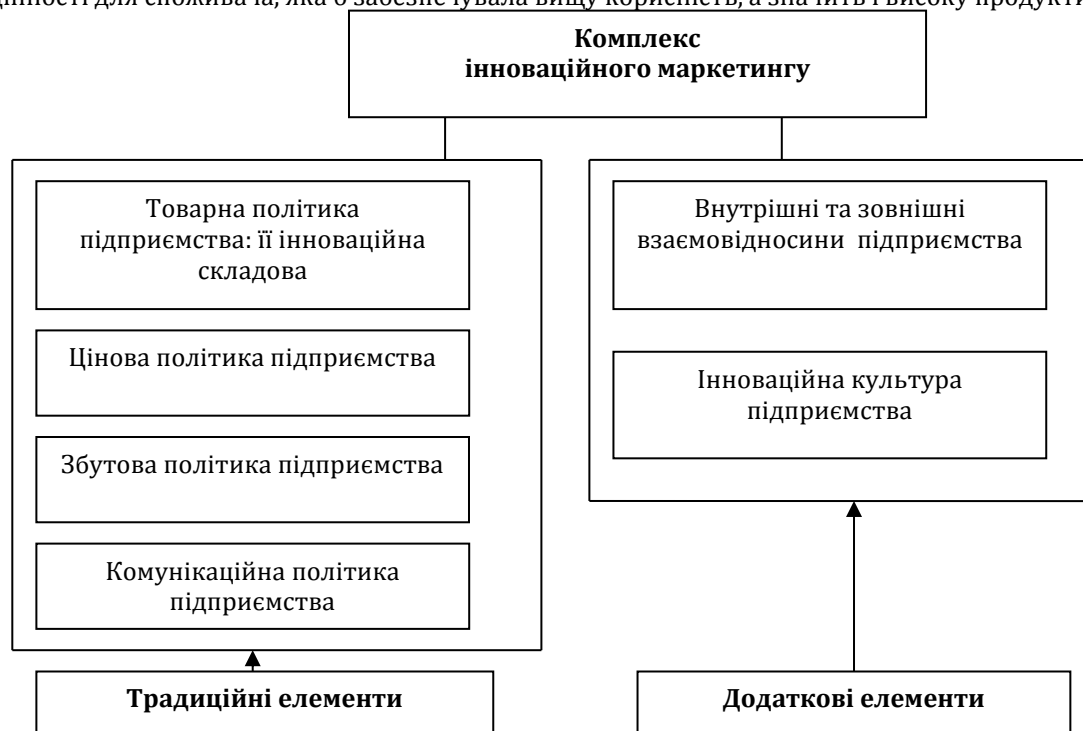
Рис. 1. Складові комплексу інноваційного маркетингу [8, с. 45]

запити», «збуту→зручність дистрибуції», «ціни→витрати споживача» та «промоції→комунікації») [8, с. 9]. Наявність таких досліджень доводить необхідність при удосконаленні комплексу маркетингу більшої уваги до складової «споживач-клієнт», що було першопричиною виникнення класичної теорії маркетингу. Однак, на нашу думку, зміни тут доцільні насамперед у частині створення такої нової цінності для споживача, яка б забезпечувала вищу корисність, а значить і високу продуктивність праці.