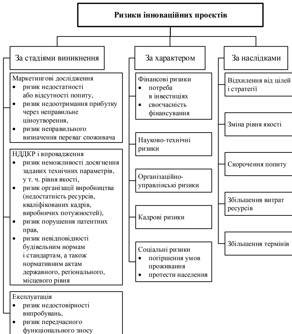
Рис. 1. Класифікація ризиків інноваційних проєктів

Етап 2 – етап формування числових значень чинників ризику; як і на попередньому етапі, числові значення формуються для окремих одиничних і групових чинників ризику.