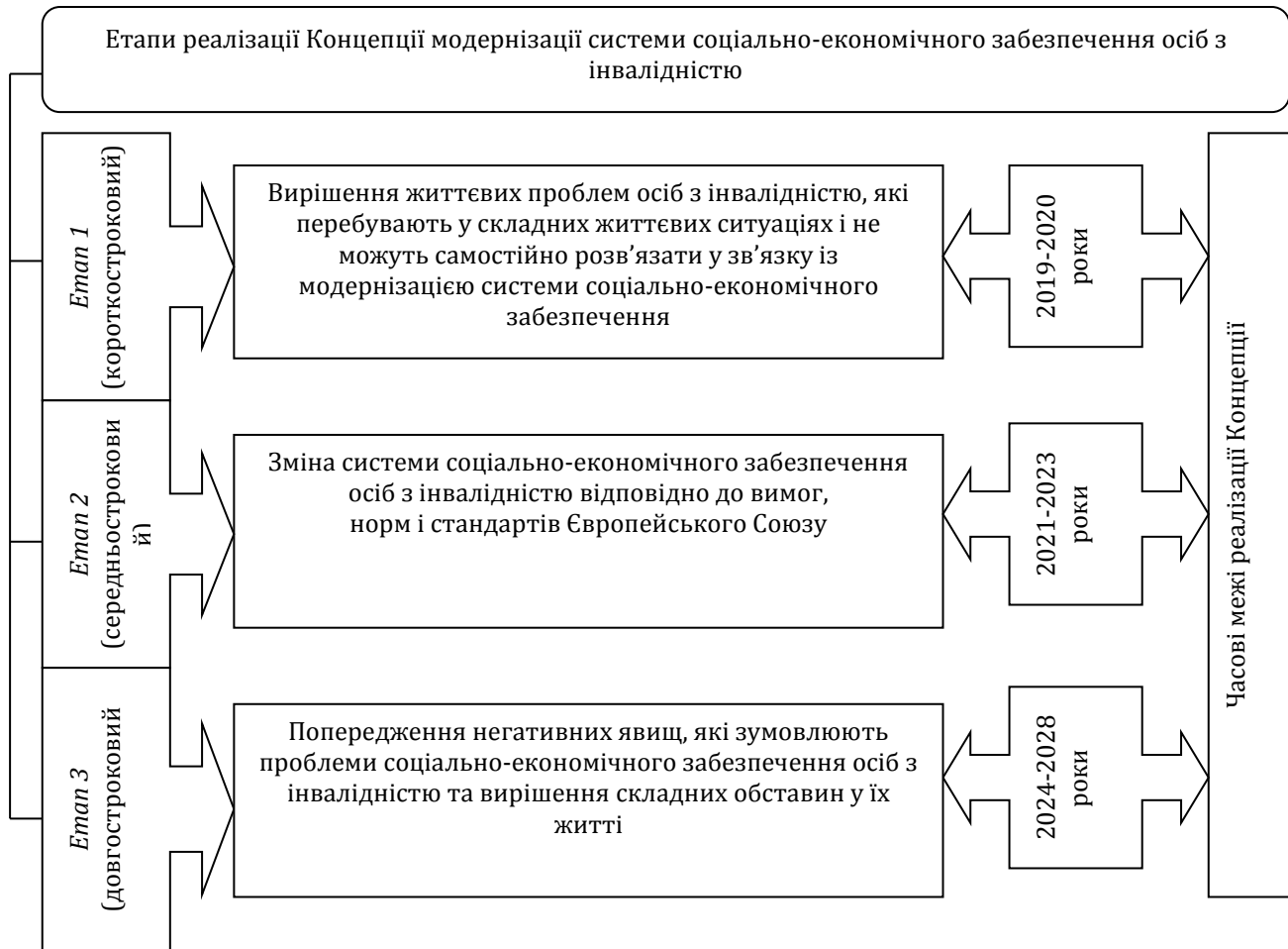
Рис. 1. Етапи реалізації Концепції модернізації системи соціально-економічного забезпечення осіб з інвалідністю в Україні*

Модернізація системи соціально-економічного забезпечення осіб з інвалідністю повинна проводитися системно, цілеспрямовано та базуватися на таких основних принципах та критеріях ефективності її функціонування: