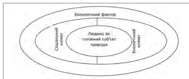
Рис. 1. Взаємодія основних факторів розвитку соціально-економічних систем, орієнтованих на людину

У цьому контексті доцільно розглядати розвиток як загальний процес в органічній єдності екологічного, соціального, людського та економічного розвитку. Зазначений