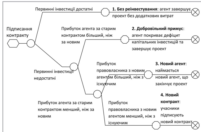
Рис. Сценарії реалізації національного проекту

Враховуючи вищезазначене, схематично зобразимо чотири можливі сценарії реалізації проекту (рис.).