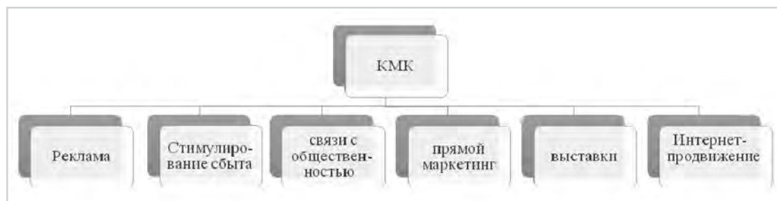
Рис. 1: Маркетинговый коммуникационный комплекс 6-ти элементов

Использование указанной выше модели комплекса маркетинговых коммуникаций проанализируем на конкретном примере в сфере неформального образования. Неформальное образование в Латвии, наряду с формальным, регулируется Законом об образовании. Неформальное образование – это последующее образование, которое следует за основным. Выбор направления неформального образования зависит от потребности, запроса, приоритета и желания каждого индивидуума [13]. К предприятиям, предлагающим услугу в неформальном образовании, относятся школы по обучению вождению транспортных средств. Иными словами – автошколы. В Латвии насчитывается 309 автошкол и курсов вождения [14]. Для проведения исследования из общего числа предприятий были выбраны два объекта, а именно: автошколы «Autoprieks/Credo» и «Fortuna» в Риге. Предоставим их общую характеристику.