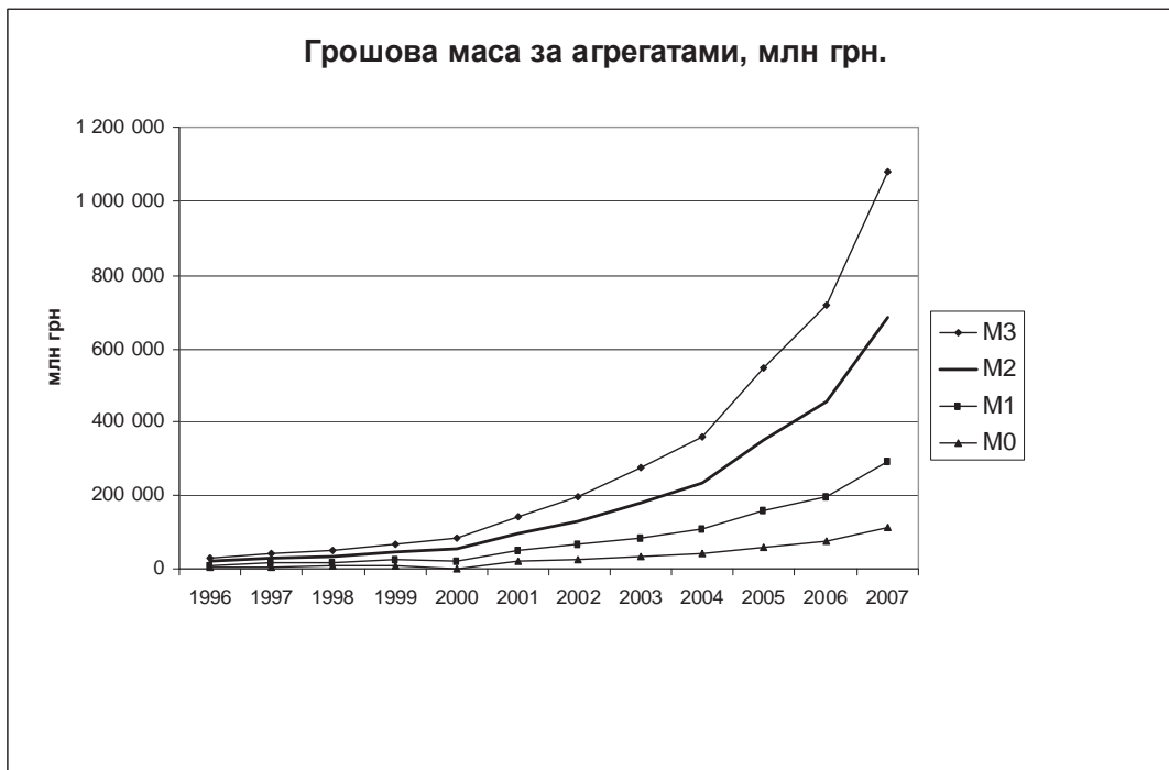
Рис. 2. Грошова маса