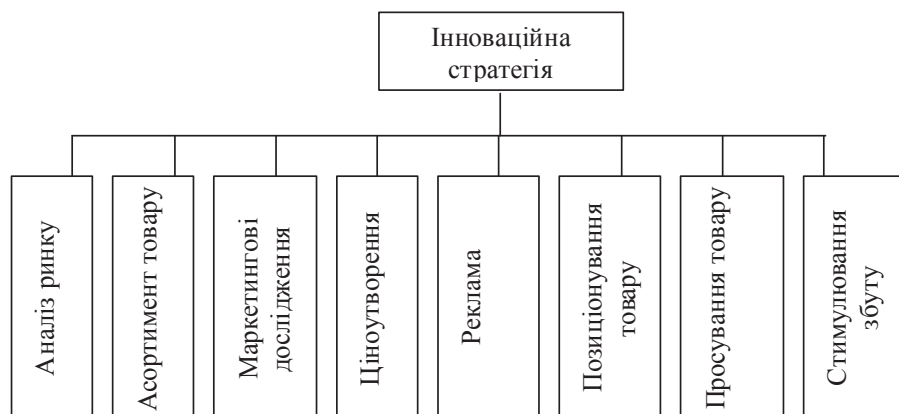
Рис. 1. Складові інвестиційної діяльності

Стратегічне управління системою охорони здоров'я не обмежується лише суб'єктно-об'єктивними відносинами, а включає також управління процесами в цій системі. Особливу увагу слід акцентувати на-