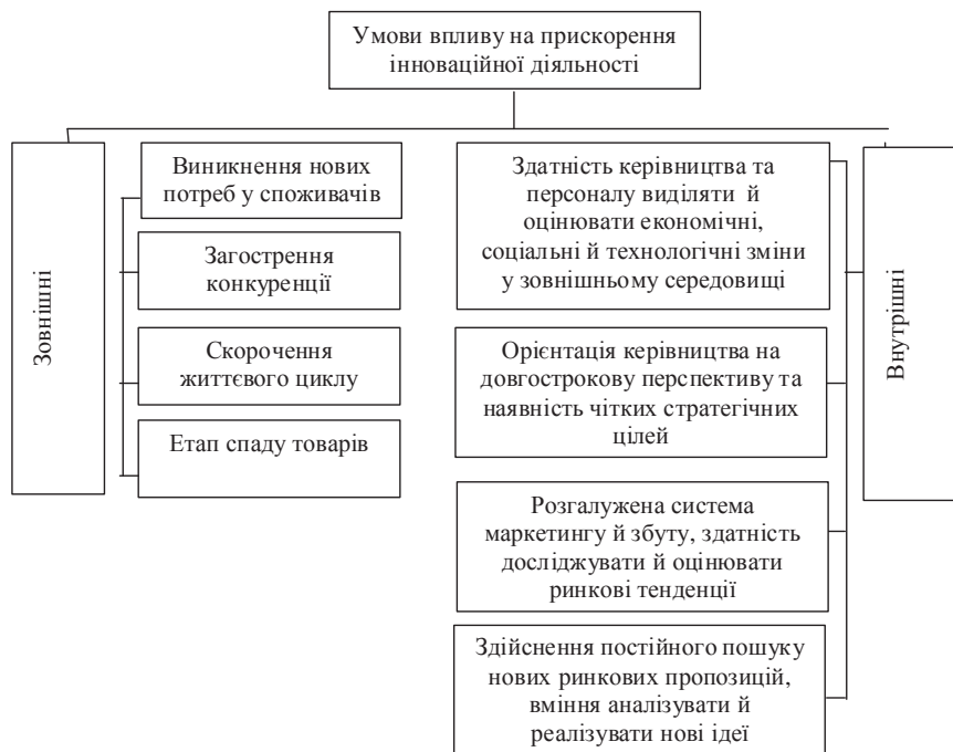
Рис.3. Умови впливу на прискорення інноваційної діяльності

За прогнозними даними ООН, загальна кількість населення зменшиться до 43784,8 тис. осіб у 2015, загальна кількість сімей — до 12,4 млн на початок 2015 року [3]. Також очікується подальше старіння населення — щодо 2015 року, питома вага осіб старше 60 років досягне 21,7% загальної чисельності населення (серед жінок — 26%, чоловіків — 16,8%), при цьому на 1000 осіб працездатного віку припадатиме 438 осіб пенсійного віку.