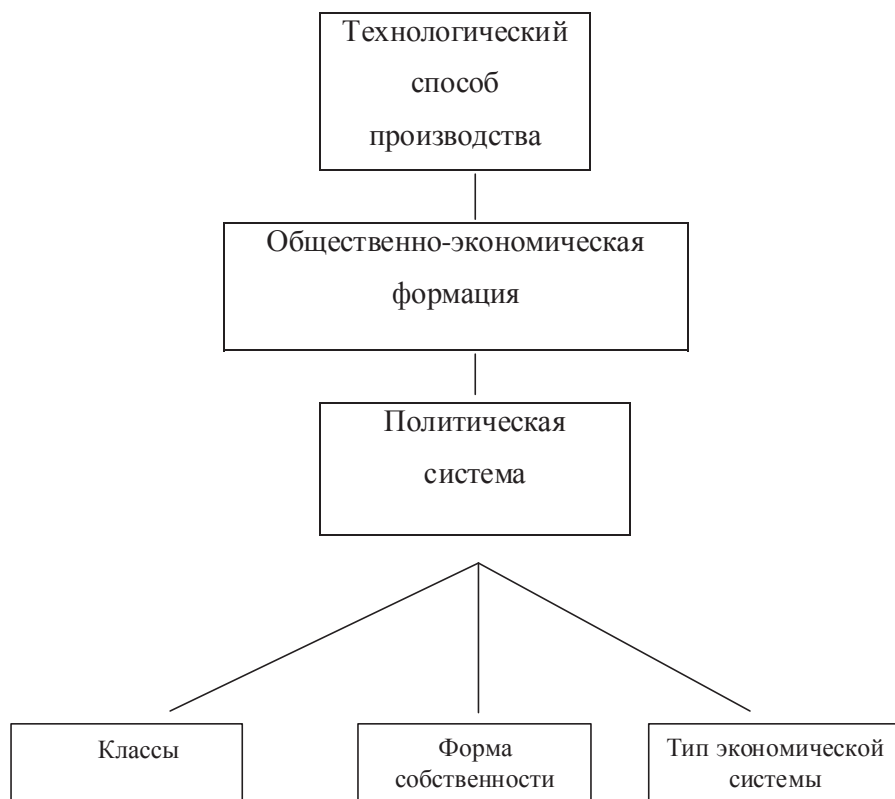
Рис. 2. Формування суспільно-економічної формації

Оскільки в кожній суспільно-економічній формації зберігаються рештки класів старого суспільства і народжуються нові, то існують також неосновні класи, наприклад, буржуазія в феодальному суспільстві, поміщики і селяни в капіталістичному суспільстві. Між основними антагоністичними класами в старому технологічному способі виробництва і новими класами, володіючими новими технологіями в зародку прогресивного способу виробництва,