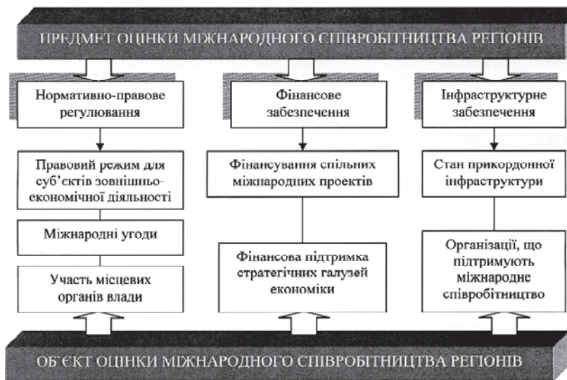
Рис. 1. Система оцінки інституціонального складника міжнародного співробітництва регіонів

Існуючі методичні підходи до оцінки ефективності міжнародного співробітництва регіонів не враховують вплив державної політики. Урядова політика може покращити стан окремих розвинених факторів через прийняття законодавчих актів, дофінансування спільних міжнародних проектів, передачі частини повноважень в сфері міжнародного співробітництва на мезорівень управління. На відміну від випадкових подій, виникнення яких неконтрольоване, дії уряду є чинником передбачуваним і суб'єктивним і, відповідно, вони можуть підлягати коригуванню. Таким