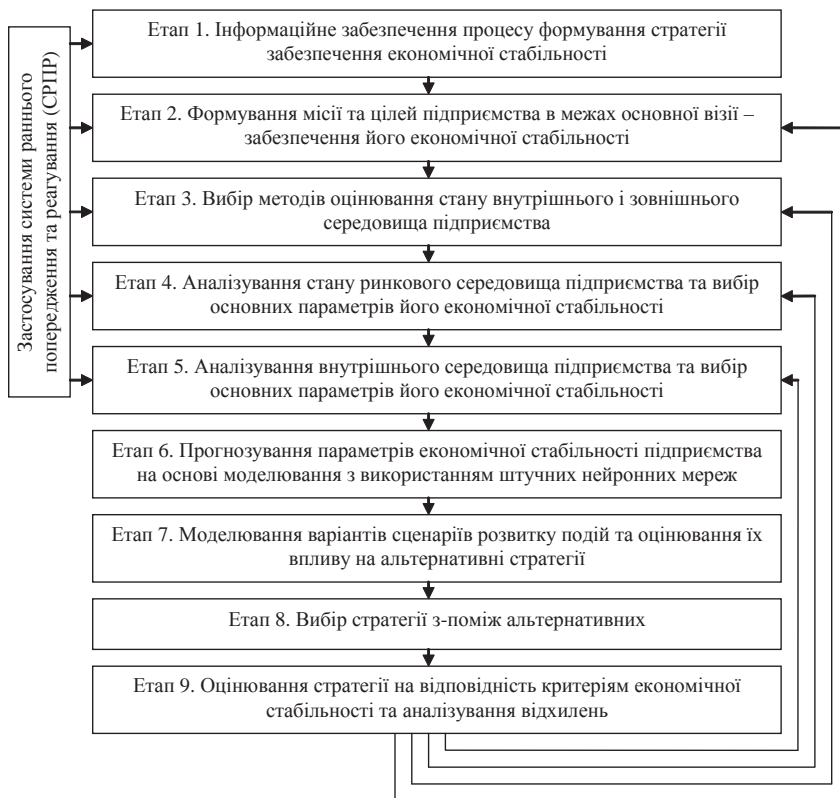
Рис. 3. Схематичне зображення етапів формування стратегії забезпечення економічної стабільності підприємства

складова стратегії забезпечення економічної стабільності підприємства охоплює декілька послідовних етапів і є безперервним. Ефективність даного процесу безпосередньо залежить від формування чітких цілей, визначення реальних проблем та загроз для підприємства, а також ретельного вибору індикаторів раннього попередження [11].