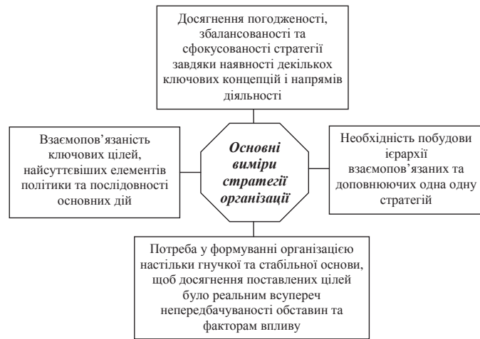
Рис. 1. Виміри стратегії організації

Процес організації системи раннього попередження та реагування як