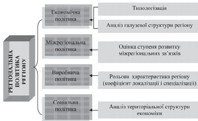
Рис. 2. Оцінка регіональної промислової політики з використанням методів регіонального аналізу

де v — вивіз продукції; w — ввезення продукції; q — обсяг виробництва.