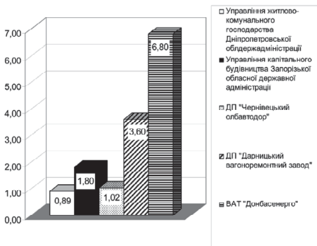
Рис. 2. Приклади виявлених зайвих витрат у сфері державних закупівель шляхом оперативного контролю

Перевіркою у ВАТ "Дніпропетровський тепловозоремонтний завод" також встановлено факт недотримання норм стосовно закупівель безпосередньо у виробників торгів. При порівнянні цін на дизпаливо та бензин, які зазначені у тендерній пропозиції і договорі з переможцем — ТОВ ВКП "Енергія", з цінами виробника ЗАТ "Укртатнафта" встановлено, що вартість придбання палива безпосередньо у виробника була б на 265,8 тис. грн. менш, ніж у посередника ТОВ ВКП "Енергія" (рис. 1).