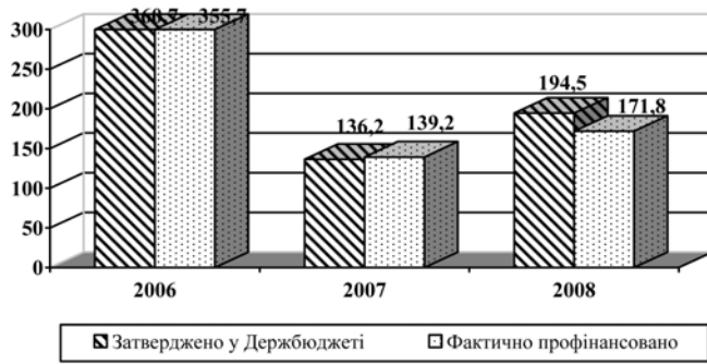
Рис. 1. Фінансове забезпечення коштами державного бюджету заходів щодо збереження пам'яток культурної спадщини у 2006–2008 роках (млн грн.)

За КПКВ 2761080 "Субвенція м. Львову" на 2008 рік передбачено 30 млн грн., фактично асигновано 19,9 млн грн. (66,3 % плану).