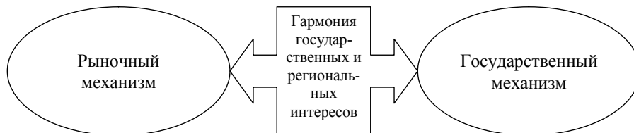
Рис. 1. Схема взаимодействия государственного и рыночного механизмов

Мировой опыт показывает, что при выборе определенной модели