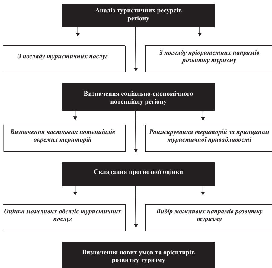
Рис. 1. Алгоритм маркетингового аналізу туристських територій

1. Формування регіональної нормативно-правової бази розвитку туризму в регіоні й системи регулювання туристської діяльності. Захист регіонального туристського ринку шляхом надання податкових пільг, державних гарантій та інших способів державної підтримки.