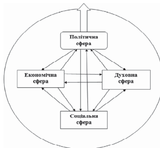
Рис. 3. Квадра взаємодіючих і взаємозалежних сфер організації суспільства

Отже, вихід України з системної кризи, на думку автора, пов'язаний з реалізацією тріади стратегій виходу Украї-