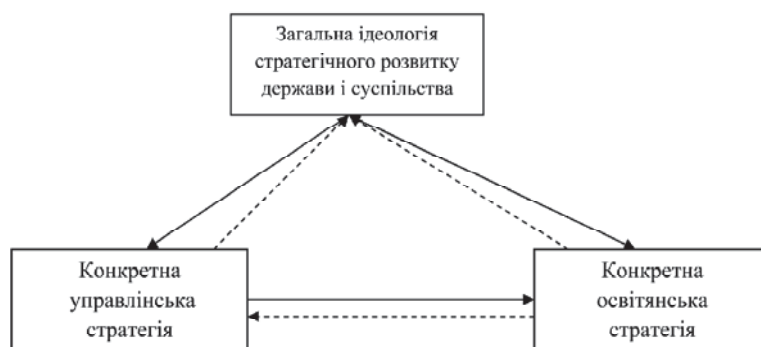
Рис. 4. Тріада стратегій виходу України з системної кризи

ни з системної кризи, що базується на єдиному фундаменті — сприяння самореалізації особистості, що складає сутність ідеології людиноцентризму і громадянського суспільства. Проголошення, а потім конкретне приведення в життя запропонованої тріади через механізми цільового державного управління суттєво покращить той морально-економічний стан суспільства, який економічними і неекономічними (духовними) методами дозволить вирішувати проблему оздоровлення нації і підвищення якості життя громадян.