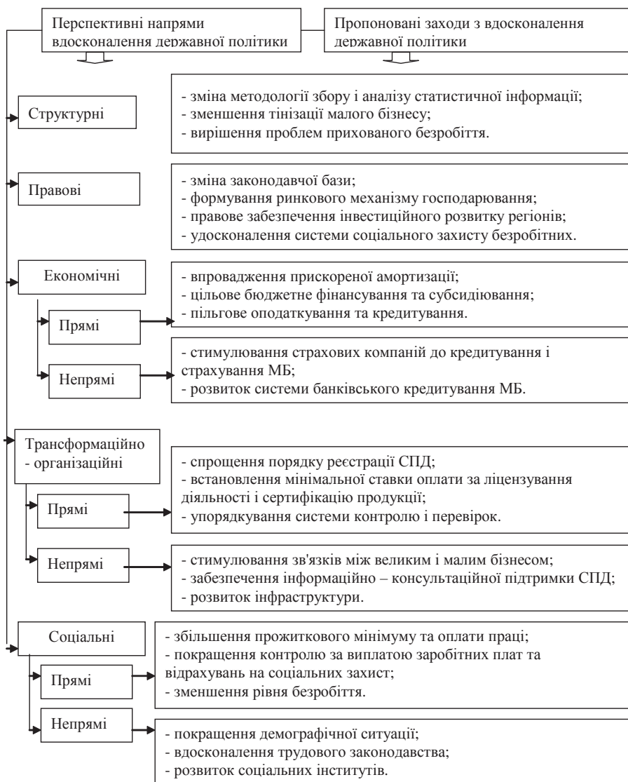
Рис. 1. Перспективні напрями вдосконалення імплементації засад державної політики в сфері підприємництва та розвитку людського ресурсу.

ця та матиме у підсумку позитивний вплив на результативність використання трудового потенціалу людського ресурсу.