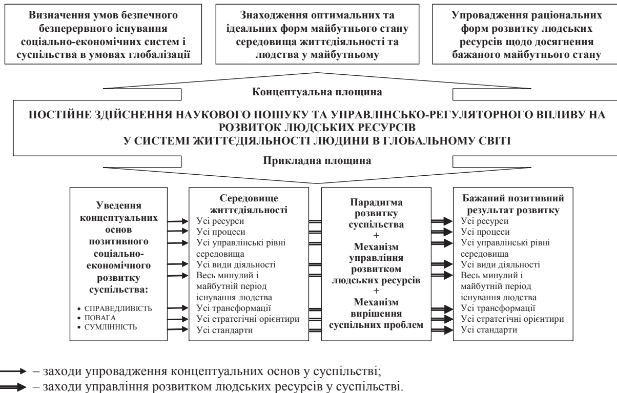
Рис. 2. Схема теоретичної моделі нової глобальної економічної системи координації розвитку людських ресурсів у XXI ст.*