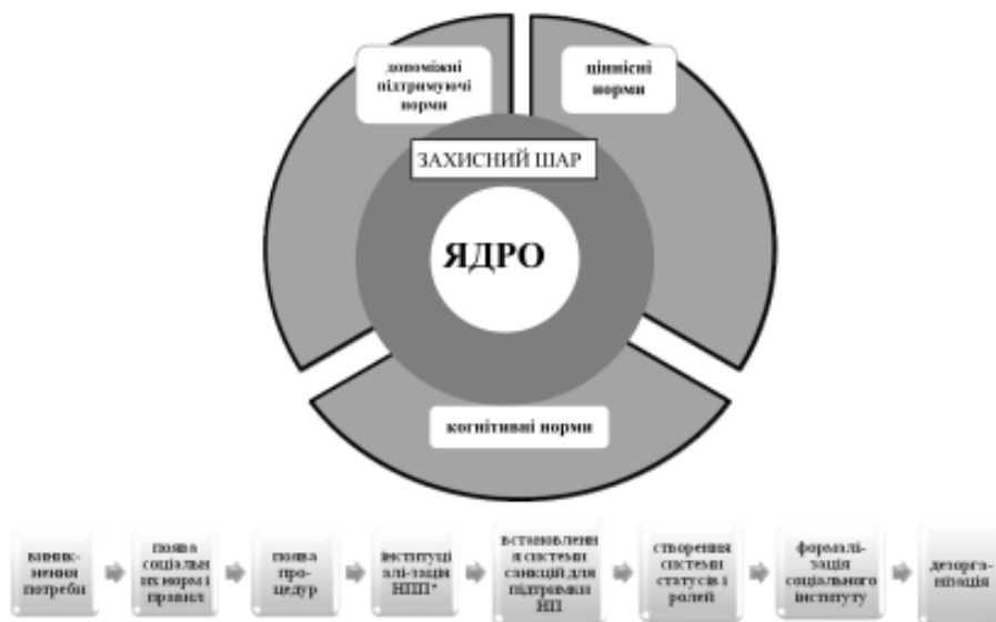
Рис. 1. Структура та життєвий цикл інституту

Застосування методу класифікації до дослідження інститутів дозволяє виділити: за ознакою формальності — формальні та неформальні інститути; за кількістю виконуваних функцій — монофункціональні (фірма) та поліфункціональні (сім'я); за напрямком впливу — ексгенні та ендогенні; за сферою діяльності — правові, економічні, соціальні, освітні, релігійні тощо. (рис. 2). Т. Веблен у найбільш загальній формі поділяв економічні інститути на фінансові та виробничі. Г. Спенсер виділяє такі види соціальних інститутів, як побутові, обрядові, політичні, релігійні, професійні та промислові. Д. Норт вирізняє: неформальні обмеження (санкції, заборони, звичаї, традиції та правила поведінки) і формальні правила (конституції, закони, право власності) [12, с. 97]. Г. Клейнер класифікує інститути за критеріями: тип суб'єктів, який охоплює визначена норма; множина суб'єктів даного типу, що дотримуються визначеної норми (фактичних носіїв інституту); сферу ухвалення рішень, діяльності чи взаємин суб'єктів, регламентованих даною нормою; час виникнення, період стійкості інституту; ступінь формалізації інституту; тип механізму безпосереднього інформування про визначену норму; тип механізму безпосереднього контролю за дотриманням норми. За