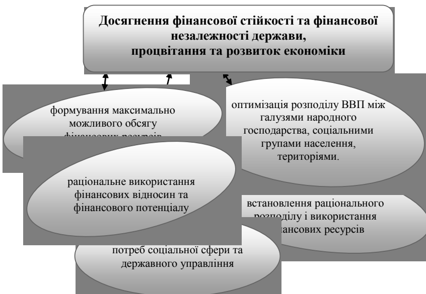
Рис. 2. Основна мета фінансової політики та шляхи її досягнення

Даниленко А.І. у своїй праці "Фінансова політика та податково-бюджетні важелі її реалізації" зазначає про необхідність ототожнення фінансової політики не лише з державними фінансами, а і з бюджетною політикою. Автор вважає, що фінансова політика повинна враховувати виробничу специфіку фінансів і що її слід розглядати як сукупність цілеспрямованих дій держави щодо формування і ефективного використання фінансових ресурсів країни, які