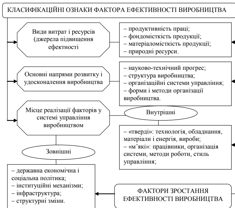
Рис. 1 Інтегрована модель чинників ефективності виробництва (продуктивності діяльності підприємства як виробничо-економічної системи)

На ефективність діяльності сільськогоспо-