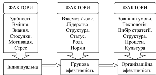
Рис. 2. Модель взаємозв'язку видів ефективності та факторів, що впливають на їх рівень

— цільові системи, де мета не зумовлена внутрішньою організацією і має, по суті, характер розвитку;