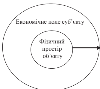
Рис. 4. Структура елементарної частки економічного простору

собою мережову систему взаємодій, що виникають у процесі економічної діяльності суб'єктів господарювання. За змістом сутність економічного простору визначається притаманними йому функціями.