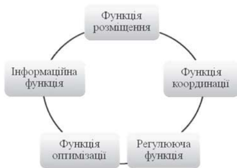
Рис. 2. Функції регіонального економічного простору