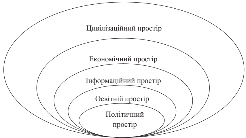
Рис. 6. Структура антропоного виміру глобального простору

Протилежної думки дотримується О.Гранберг, який вважає, що кожна територія має свій економічний простір, який знаходиться у взаємозв'язку із зовнішнім простором. Він виокремлює два якісно визначених типи просторової архітектури регіону: однорідну та вузлову, — які складаються з певних елементів (точка, вузол, ядро, периферія). Визначеним типам відповідають чотири види просторових