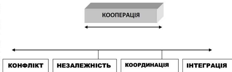
Рис. 1. Спектр Добсона "Політика — конфлікт — незалежність — інтеграція"

Проблема розмежування феномена інтеграції є певною мірою штучною, адже сама по собі інтеграція — це безперервний процес зміни характеристик. Упродовж тривалого періоду поширеним був розгляд інтеграції лише з позицій "форми" і "процесу", однак варто зважати на те, що в межах інтеграційних процесів існують значні якісні стадії, су-