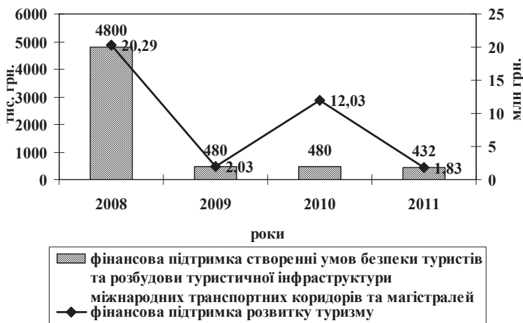
Рис. 1. Видатки державного бюджету на фінансування сфери туризму України в 2008–2011 рр.

Сьогодні в більшості країн світу з метою формування та реалізації туристичної політики на державній основі створені національні туристичні організації, основним завданням яких є загальне управління розвитком туризму, збільшення фінансових надходжень від інозем-