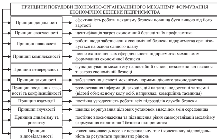
Рис. 1. Принципи побудови економіко-організаційного механізму формування економічної безпеки підприємств