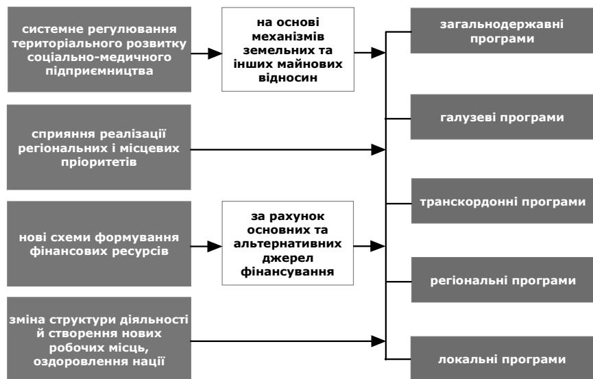
Рис. 1. Засоби розв'язання проблем територіального розвитку на державно-регіональному й місцевому рівнях

Діючі нині механізми утворення й розподілу доходу в соціально-медичній сфері є результатом ринкового реформування економіки країни та нової системи оподаткування доходів і прибутку підприємств. Першим і основним джерелом отримання валового доходу в соціально-медичній сфері має бути дохід від реалізації соціально-медичних послуг. Це джерело доходу повинно виступати у формі виручки, вираженої в цінах реалізації з урахуванням ПДВ. Інші джерела отримання доходу соціально-медичними підприємствами повинні відігравати допоміжну роль, але це не означає, що їх можна ігнорувати. Початковим етапом розподілу валового доходу повинно виступати його коригування (зменшення) на суми, які по своїй суті не є доходами підприємства, і на ті суми доходу, з яких уже сплачено податок на прибутки.