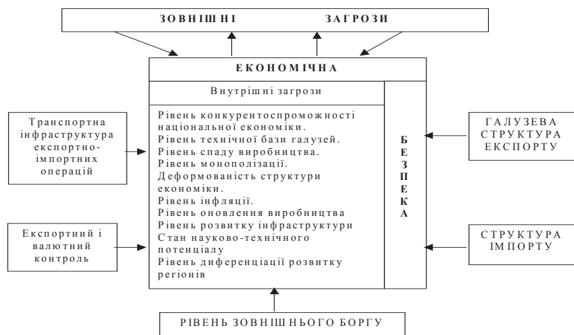
Рис. 2. Зовнішні та внутрішні загрози економічній безпеці

інвестиційна активність і переважання вкладення капіталів у посередницьку і фінансову діяльність на збиток виробничій; збільшення майнової диференціації населення і підвищення рівня бідності.