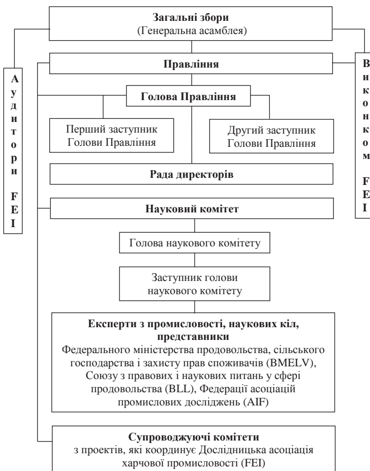
Рис. 2. Схема структури управління Науково-дослідною групою харчової промисловості Німеччини (FEI)

асоціація харчової промисловості) (FEI). Це формування об'єднує близько 55 галузевих асоціацій, що представляють інтереси більш ніж 90 % підприємств харчової індустрії. Серед цих підприємств значна кількість харчових ремісничих підприємств, а також суб'єктів господарювання із суміжних галузей. При цьому 60 компаній є прямими членами FEI і безпосередньо беруть участь у її роботі [2].