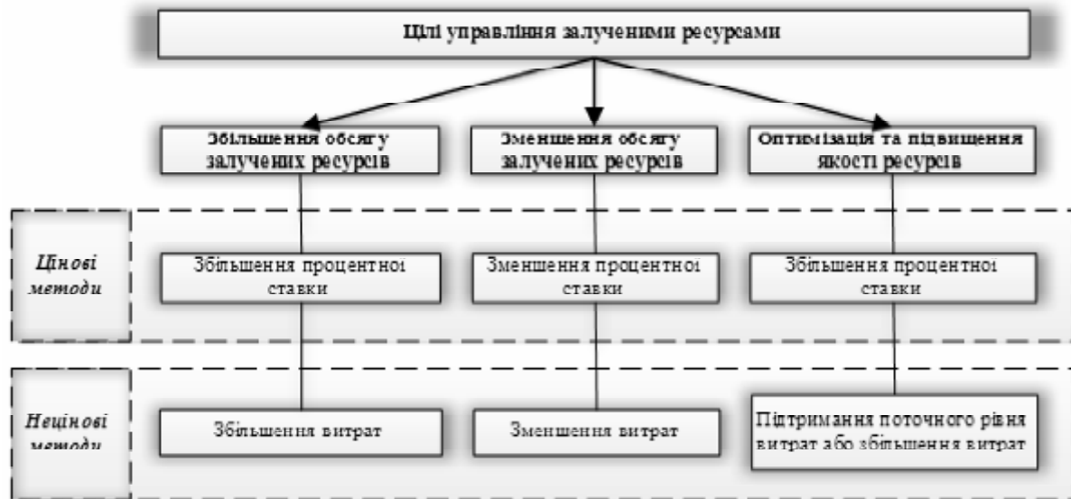
Рис. 3. Застосування методів управління залученими ресурсами для досягнення управлінських цілей банку

кої справи Національного банку України. — Суми, 2007. — 37 с.