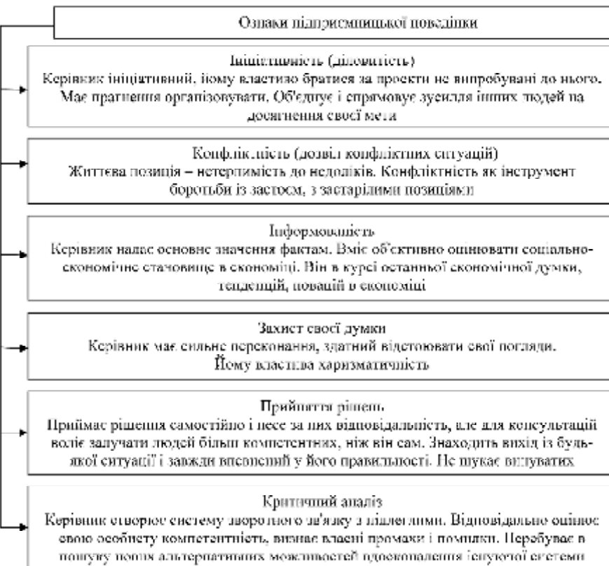
Рис. 3. Ознаки підприємницької поведінки

ти, і для бізнес-середовища. Це пов'язано насамперед з фундаментальною трансформацією зовнішнього оточення бізнесу, яке характеризується високим ступенем мінливості та невизначеності. В результаті, підприємства шукають нові способи досягнення стійкої конкурентоспроможності та стратегічної гнучкості за рахунок виділення ресурсів на дослідження і розробки, розвитку альтернативних бізнес-проектів, стимулювання підприємницької поведінки співробітників.