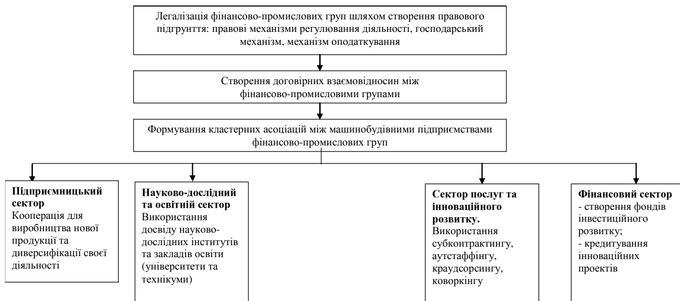
Рис. 2. Розвиток легальних кластерних інтеграційно-асоціативних процесів в машинобудівному комплексі

ня їх конкурентоспроможності, а також як механізм гнучкого реагування на кон'юнктуру світових ринків, зростання стабільності функціонування завдяки інтеграції конкурентних переваг конкретних суб'єктів економічної діяльності.