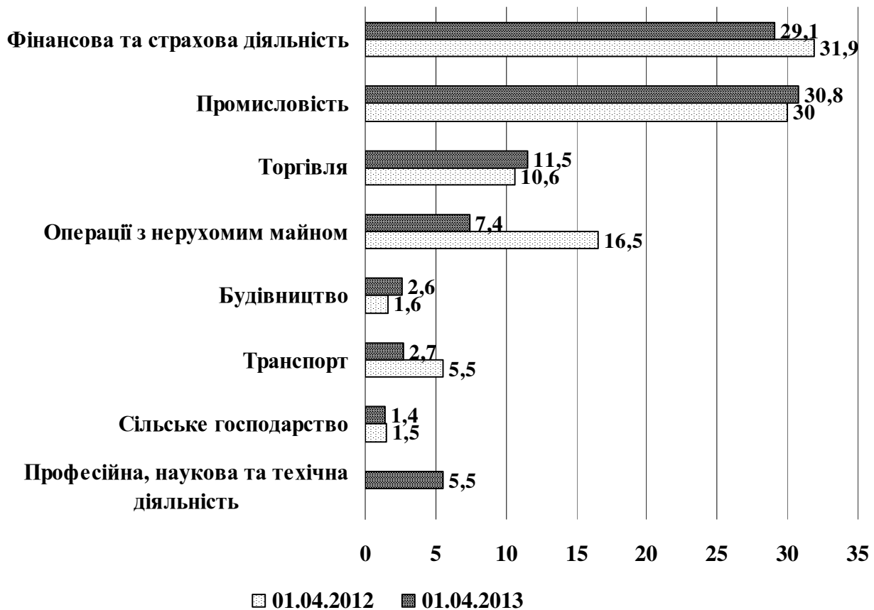
Рис. 3. Розподіл прямих іноземних інвестицій за основними видами економічної діяльності (у % до загального обсягу інвестування)