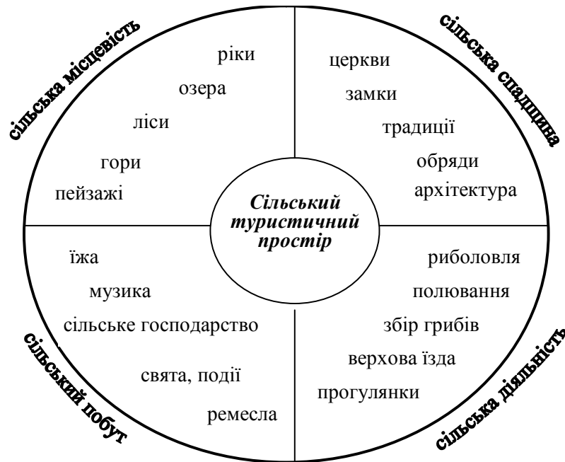
Рис. 2. Компоненти сільського туризму