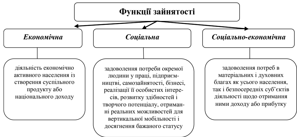
Рис. 1. Функції зайнятості населення

Досліджуючи проблеми зайнятості Л.М. Кравчук визначає зайнятість, як складну, динамічну соціально-економічну систему відносин з приводу залучення населення до трудової діяльності, задоволення суспільних інтересів і водночас індивідуальних потреб кожного працівника, що приносить йому дохід в грошовій чи не грошовій формі. Регулювання зайнятості — це комплекс заходів правового, організаційного, економічного та соціального характеру, спрямованих на досягнення продуктивної зайнятості населення країни та її регіонів [8, с. 6].