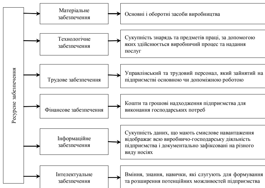
Рис. 1. Групи ресурсного забезпечення підприємства